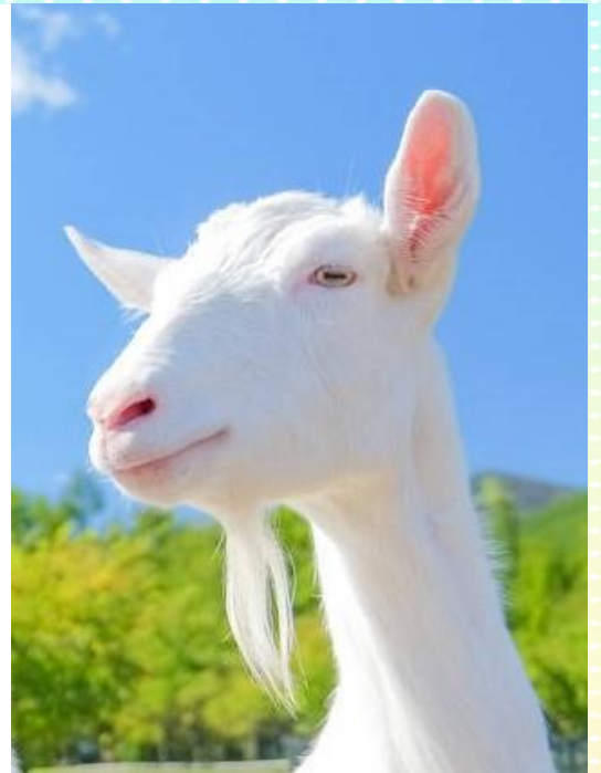
図 A は下を向いた時の写真。瞳は地面に対して水平でね。図 B は、図 A と まったく同じ写真を 90° 回転させたもの。顔に対して、瞳は ほぼ垂直。まるで猫の瞳ですね。

草を食べるときなど、顔を下に向けると、そのままでは瞳が水平になりません。顔を下に向けた分だけ、眼球を回転させて、瞳はいつも地面に対して水平になるようにしているということです。